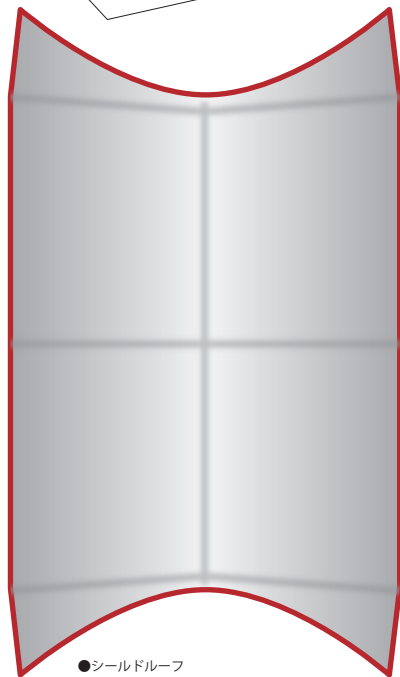
●シールドルーフ (装着するときは、屋根に接着して下さい)