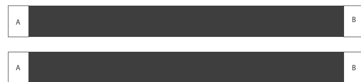
ビルディングテープ。 本体の開きを抑える